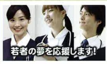
若者の夢を応援します!

定員20人 参加費無料 医療系の大学、専門学校に通う学生さんを対象とした病院見学会です。病院への就職を希望している方の参加をお待ちしております。