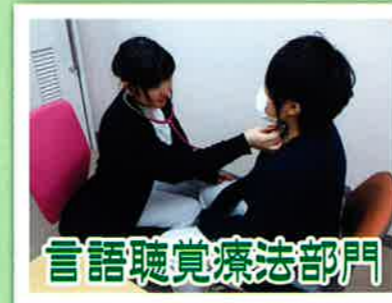
言語聴覚療法部門

作業療法とは広範囲にわたる社会生活活動を援助します。 当院では、生活の中で困難をお持ちの方、あるいは今後困難を予測される方に、身体、精神機能の維持や改善、残された機能の開発を目指し、生活動作訓練、機能訓練や作業活動などを行っています。