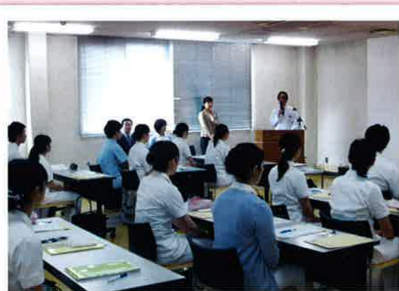
新入職者オリエンテーションの様子