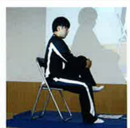
お尻の筋肉のストレッチ

続いて「お家でできる腰痛体操」と題し、当院の理学療法士2名により、体を柔らかくするストレッチや腹筋や伸筋、お尻や背中等の腰周辺の筋肉を強くする体操等をデモンストレーションを交えながら、ご紹介させていただきました。