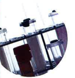
善衆会病院 診療技術部 臨床検査室