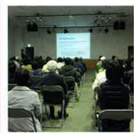
真剣に話を聞く参加者の皆さん