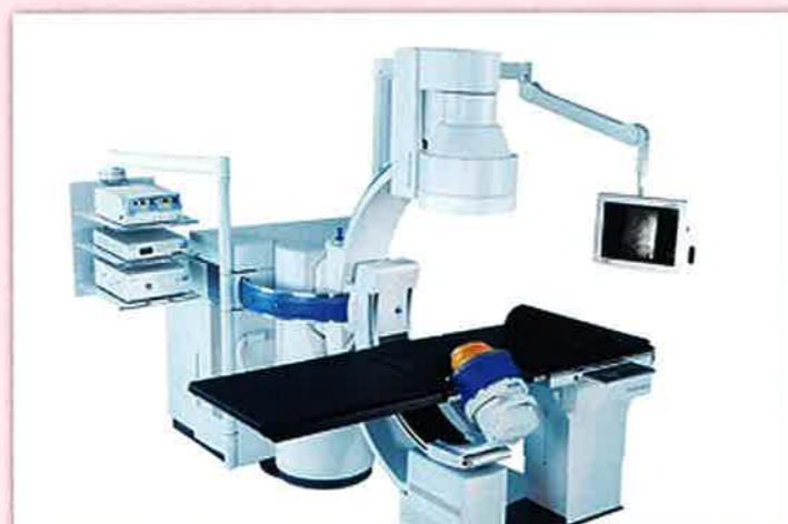
最新機器 Gemini(ジェミニ)を導入

当院では、結石により苦痛のある方はもとより、お仕事の都合や家庭の事情、学校の事情など様々な背景をお持ちの方に対し、それらのニーズを考慮し患者様やご家族がご満足を得られるような治療の提供を求め日々改善に努めております。