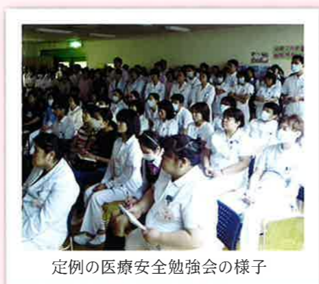
定例の医療安全勉強会の様子