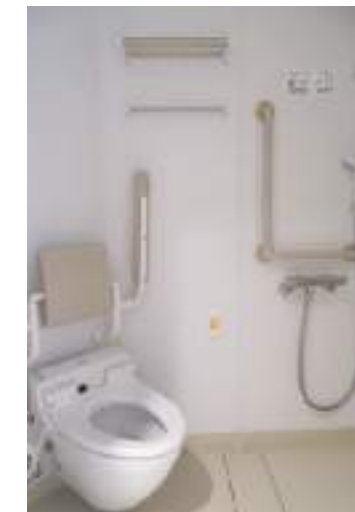
シャワーユニットブース シャワーとトイレ(ウォシュレット付)がございます。