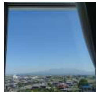
病室から外を眺めた景色 北側の病室からは赤城山が見えます。