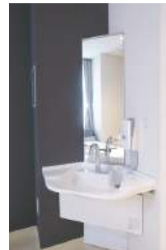
洗面台 車椅子に乗った状態でもお使いいただけます。