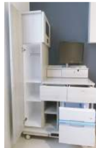
テレビ・冷蔵庫・収納 テレビ・冷蔵庫の使用料は個室料に含まれています。